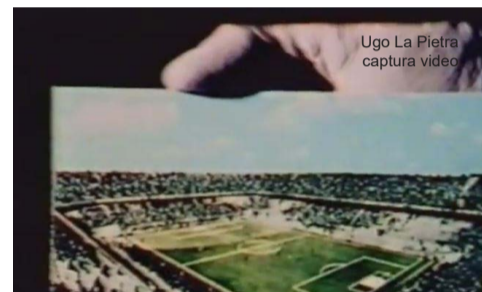
Ugo La Pietra captura video