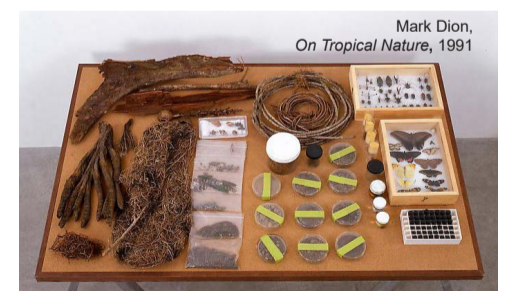
Mark Dion, On Tropical Nature, 1991

23 y 24 junio (h.11.30 -13.45) + 30 junio y 1 julio (jornadas completas con pausa comida,11.30-19.00h)