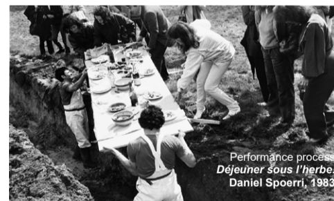
Performance process Déjeuner sous l'herbe. Daniel Spoerri, 1983