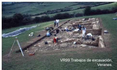
VR99 Trabajos de excavación, Veranes.

ción campo-ciudad, utilizando el acto de caminar como instrumento y metodología de interpretación del paisaje. Habitantes Paisajistas se materializa en una serie de talleres, paseos, charlas y exposiciones. La idea es crear experiencias que favorezcan un intercambio de conocimiento vivencial y desde el territorio. Cada año aborda una temática diferente: Habitantes Paisajistas 2016 giró en torno al agua, en el 2017 fue la cultura del pan.