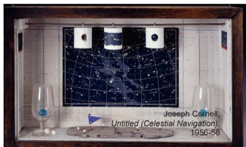
Joseph Cornell, Untitled (Celestial Navigation), 1956-58

Lugar: Villa Romana de Veranes. Inscripciones: máx. 25 personas (los niños acompañados por al menos un adulto) Precio: adultos (4 €) / niños (2 €)